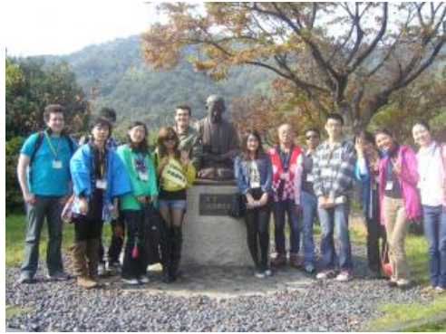
鞞之浦一日游认识很多新的朋友...