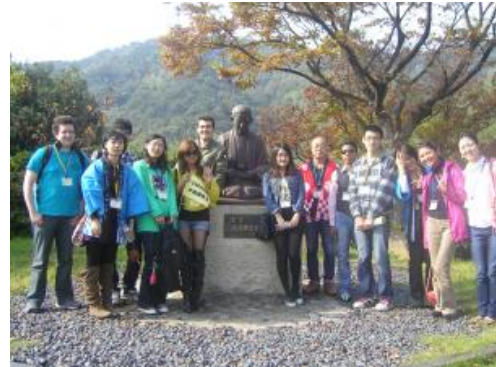
鞆の浦の一日ツアーでたくさん新しい友達が出来たよ…